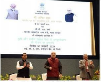
కరీంనగర్(వాయిస్ న్యూస్)ఫిబ్రవరి 1

- సహకార సంఘాల ద్వారా కోట్లాదిమందిని స్వయం ఉపాధిలో అనుసంధానం - ఎన్ సి సి బీ భారత ప్రభుత్వం ఆదేశాలకు అనుగుణంగా ప్రకటన