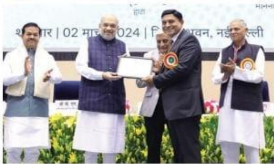
సర్దిఫికెట్ అందజేస్తున్న కేంద్ర హోం శాఖ మంత్రి అమిత్ షా

ఆయన పేర్కొన్నారు. 125 సంవత్సరాలుగా సహకార రంగం పోరాడి తన ఉనికిని కాపాడుకుంది కానీ ఇప్పుడు ప్రభుత్వ వ్యవస్థ మద్దతుతో అది వేగంగా అభివృద్ధి చెందుతుందని, దేశ ఆర్థిక వ్యవస్థలో గౌరవాన్ని సాధిస్తుందని షా తెలిపారు. సహకార ఉద్యమాన్ని ప్రజా ఉద్యమంగా మార్చేందుకు కృషి చేస్తున్నామని పేర్కొన్నారు. ప్రతి నగరంలో అర్బన్ కోఆపరేటివ్ బ్యాంకుల ఏర్పాటు లక్ష్యం కావాలని అమిత్ షా అన్నారు. ఎన్ యూ సీ ఎఫ్ డీ సీ ఏర్పాటుతో దేశంలో అర్బన్ కోఆపరేటివ్ బ్యాంకుల ..మిగతా 2లో