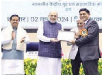
కేంద్ర మంత్రి అమిత్ షాతో రాష్ట్ర సమన్వయ కర్త