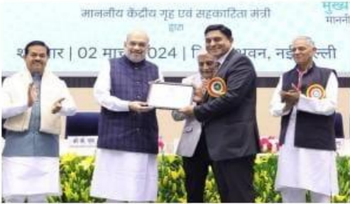
చిగురుమామిడి(వాయిస్ న్యూస్ ) చూర్చి 4