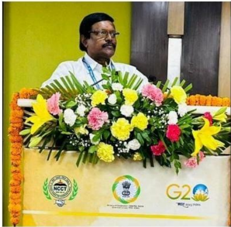
కలీంనగర్(వాయిస్ న్యూస్)ఫిబ్రవరి 6