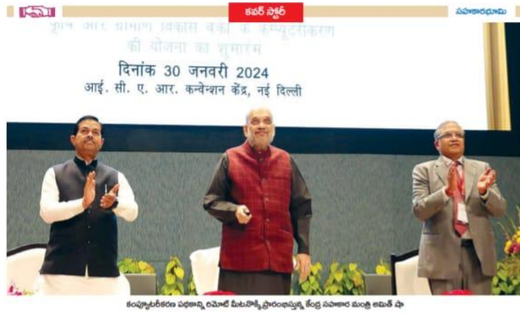
కంప్యూటరీకరణ విధానం రూపొందించే సమావేశంలో ముఖ్య అతిథి షా