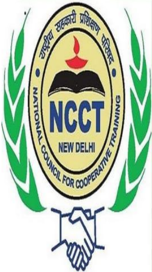
నిఘా kalam nigha 27-01-2024 Page 6 27 Jan 2024 https://epaper.kalamnigha.in/cip/34550