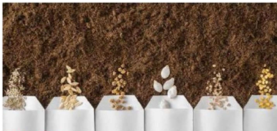
SEEDS OF GROWTH. The co-operative has the potential to sell 415 lakh quintals of seeds

The National Seeds Corporation and Indian Council of Agricultural Research (ICAR) will be co-opted on the BSBS board as expert members. ICAR has been asked by the Government to provide