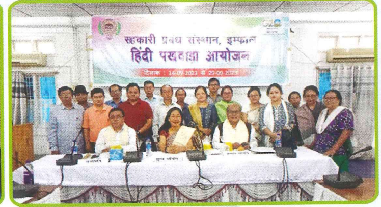
सहकारी प्रबंध संस्थान, इम्फाल