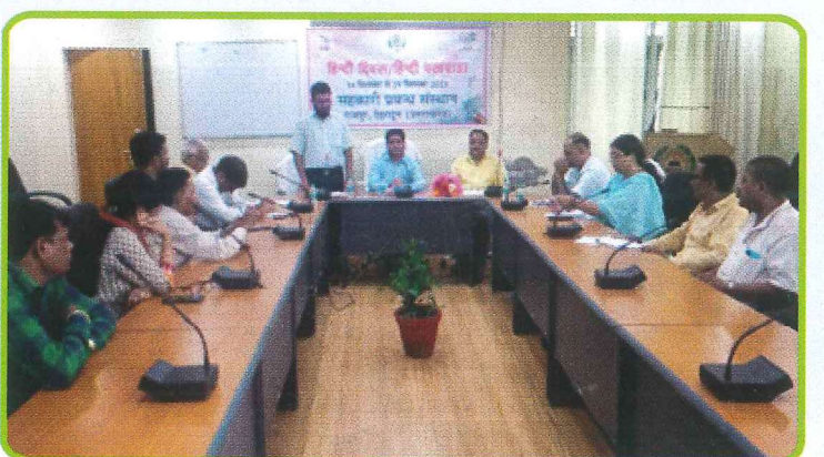
सहकारी प्रबंध संस्थान, देहरादून