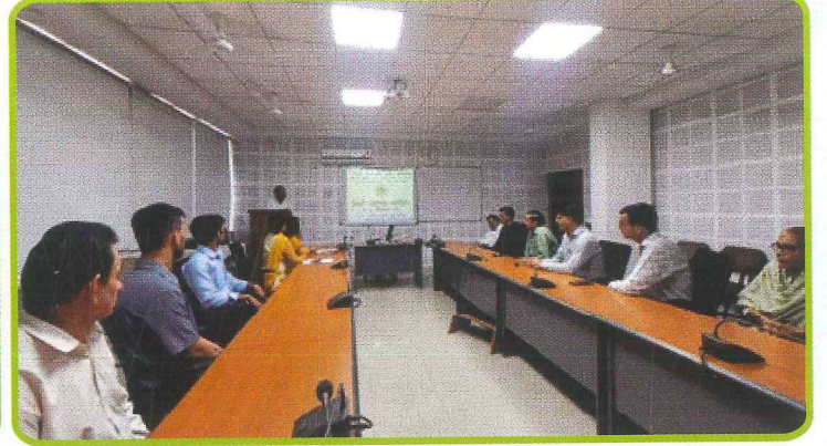
क्षेत्रीय सहकारी प्रबंध संस्थान, चंडीगढ़