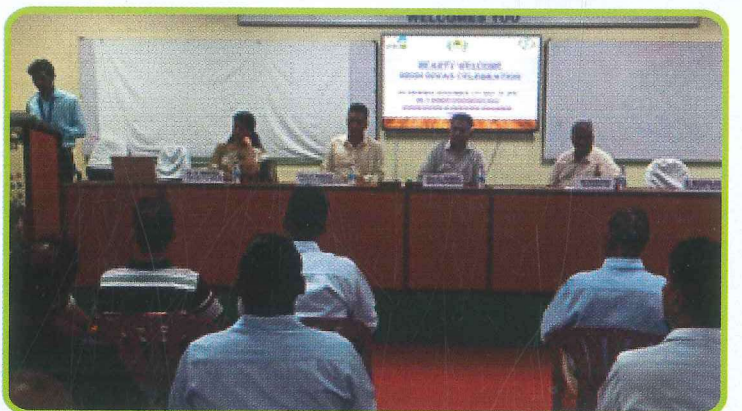
सहकारी प्रबंध संस्थान, चेन्नई