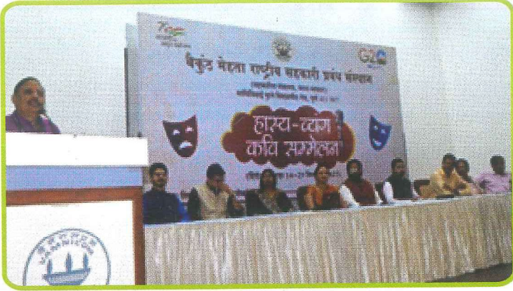
राष्ट्रीय सहकारी प्रबंध संस्थान, पुणे