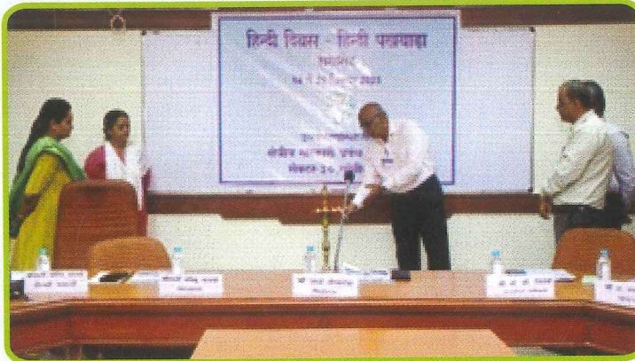
क्षेत्रीय सहकारी प्रबंध संस्थान, गांधीनगर