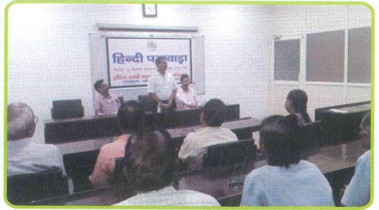
सहकारी प्रबंध संस्थान, लखनऊ