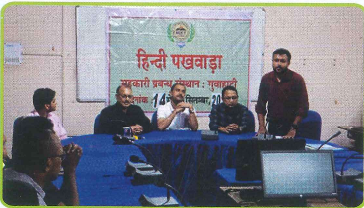
सहकारी प्रबंध संस्थान, गुवाहाटी