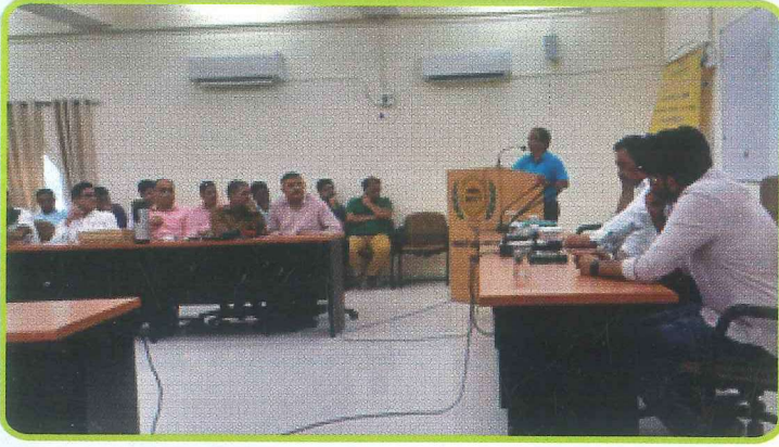
सहकारी प्रबंध संस्थान, जयपुर