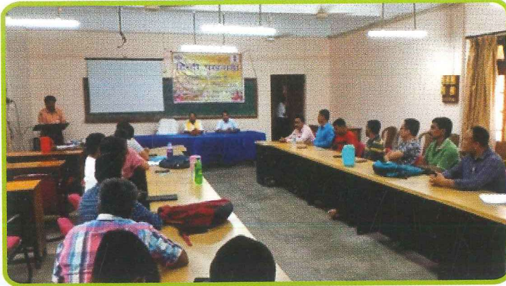
क्षेत्रीय सहकारी प्रबंध संस्थान, कल्याणी