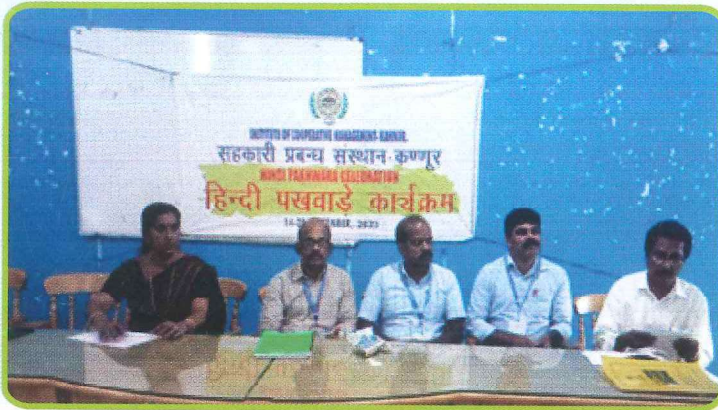
सहकारी प्रबंध संस्थान, कन्नूर