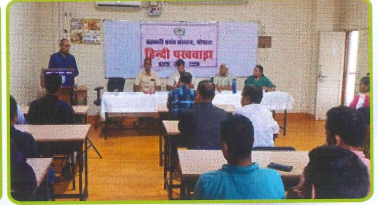
सहकारी प्रबंध संस्थान, भोपाल