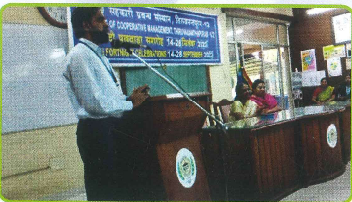
सहकारी प्रबंध संस्थान, तिरुवन्तपुरम