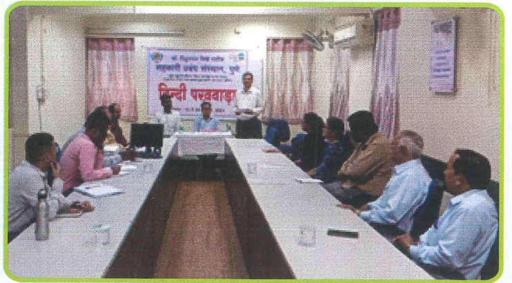
सहकारी प्रबंध संस्थान, पुणे