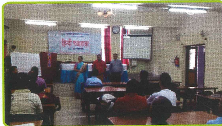
सहकारी प्रबंध संस्थान, भुवनेश्वर